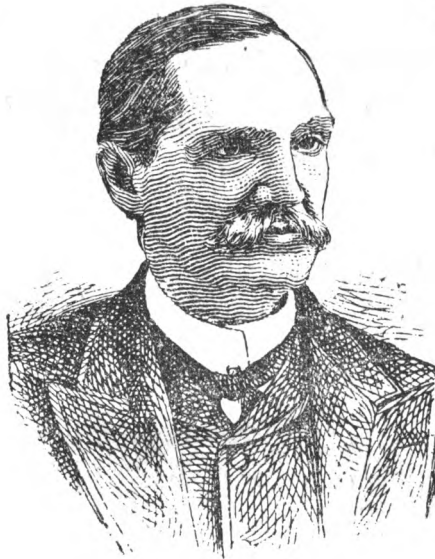
Tomás Estrada Palma.